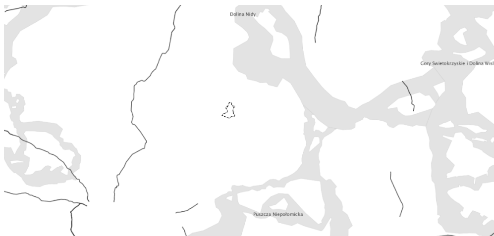
Rysunek 2. Położenie miasta Skalmierz na tle korytarzy ekologicznych

Obszar Zmiany Nr 1 „Studium” położony jest poza głównymi korytarzami ekologicznymi zwierząt o znaczeniu krajowym, co za tym idzie, realizacja ustaleń zmiany nie będzie powodować negatywnego wpływu na korytarze ekologiczne zwierząt.